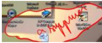
Saisie du texte sur ou à côté de la capture

5. Enfin, avec l'onglet « Envoyer vers », il est notamment possible d'enregistrer le fichier immédiatement mais aussi de l'ouvrir dans l'éditeur ce qui permet de l'enregistrer dans l'un des formats proposés (format propriétaire, format .jpg, etc.).