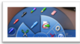
Sélection d'un stylo ou d'un feutre pour annoter la capture