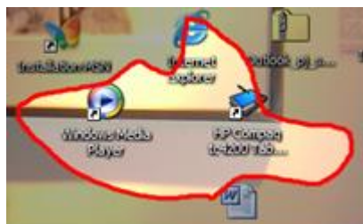
Sélection de la zone à capturer (ici, détournage libre, à la souris ou au stylet)